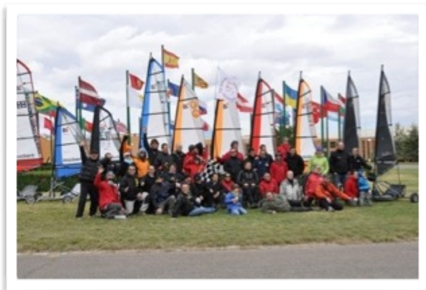
Foto de grupo - Open Internacional 2010 en la Feria de Zaragoza

https://www.dropbox.com/s/za84mkz77w6czs0/open%20zaragoza1.JPG